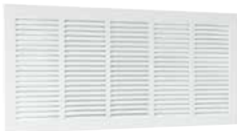
Griglia SR 377