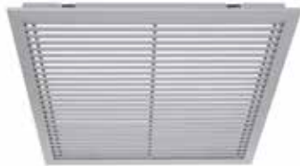
Griglia Gridlined Exhaust