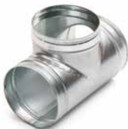
T a Squadra a 90°