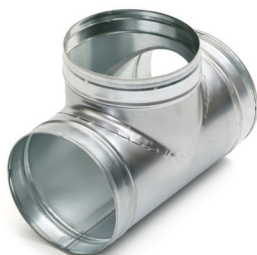
T a Squadra a 90°