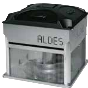
VELONE senza opzioni

VELONE F400 - 1.2 - Tri / Mono è una torretta di evacuazione fumi classificata F400-120 per locali del terziario, industriali e condomini.