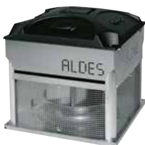
VELONE senza opzioni